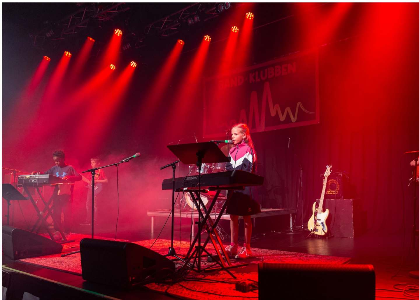
Band med bandmedlemmer på 9-11 år spiller første koncert med Bandfabrikken på Fernaten i Herning.