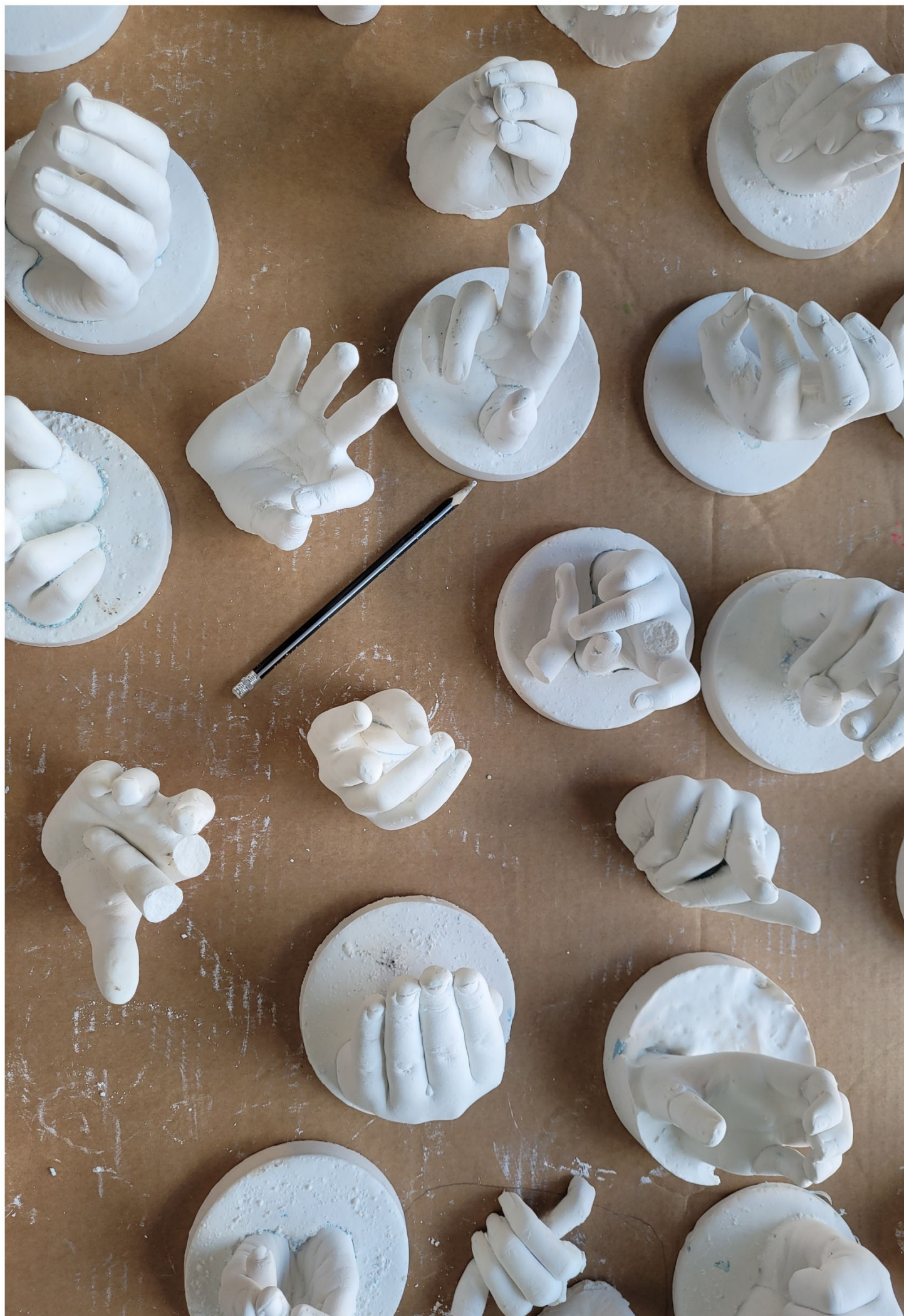
Fra et nyt kreativt miljø og inkluderende fællesskab i Gribskov, Hillerød, Helsingør og Halsnæs Kommuner: Giv scenen fri.