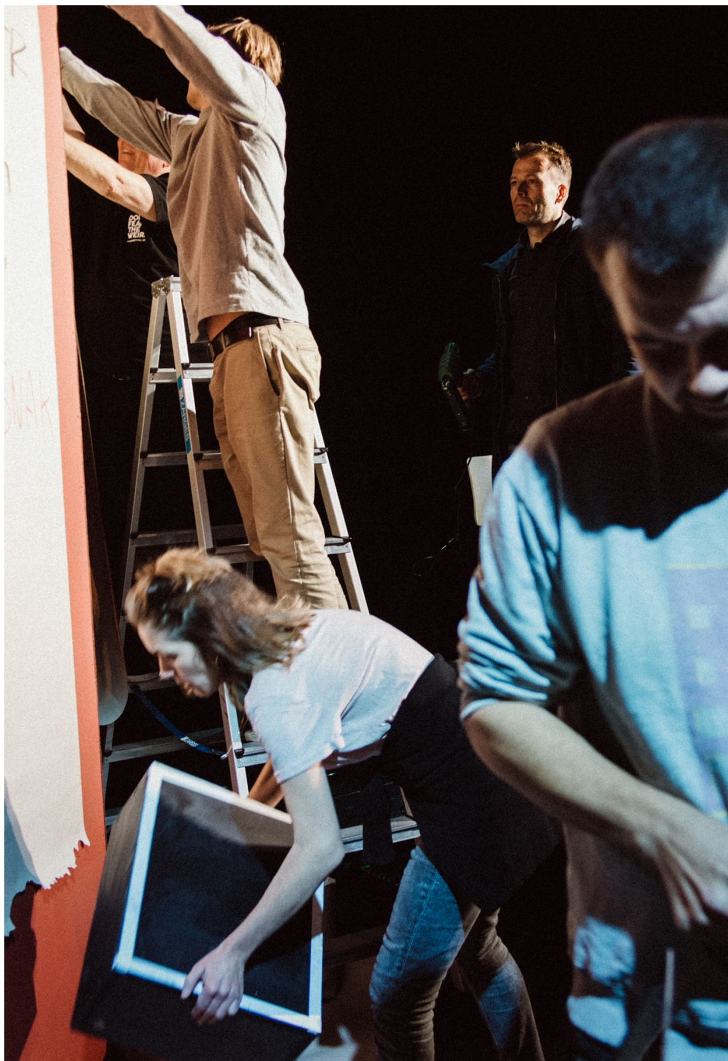
Fra forestillingen "Livsglæde og alt det rundt om", Story of My Life , Gentofte 2021.