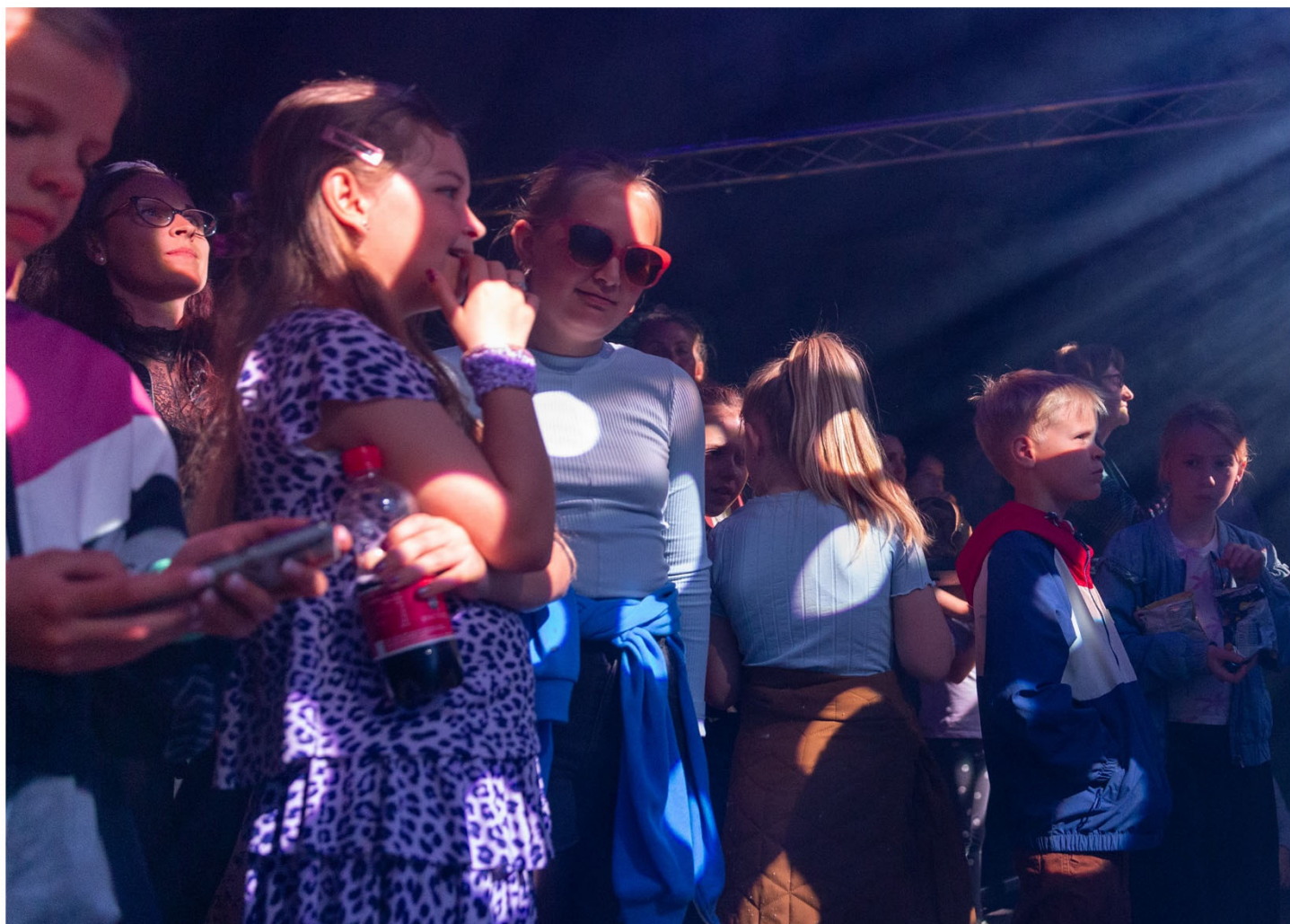
Bandmedlemmer på 9-11 år spiller første koncert og agerer publikum med Bandfabrikken på Fermaten.