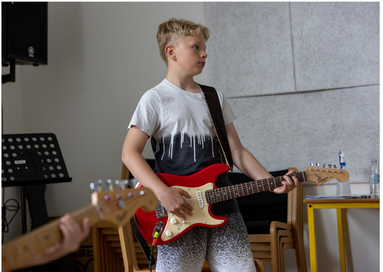
Band i øvelokale med banddoktor på Ikast-Brande Musikskole – Bandfabrikkens Sommercamp. Guitarist på Bandfabrikkens Sommercamp på Holstebro Musikskole.