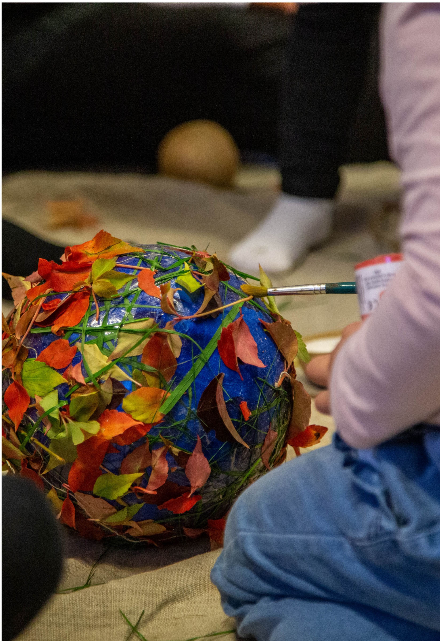
De helt små børn har i billedkunst arbejdet med den runde form. De skaber planeter på blå bolde, iklædt dobbeltklæbende tape. I hverdagen finder børnene og pædagogerne naturmaterialer til planeten hjemme i institutionen.