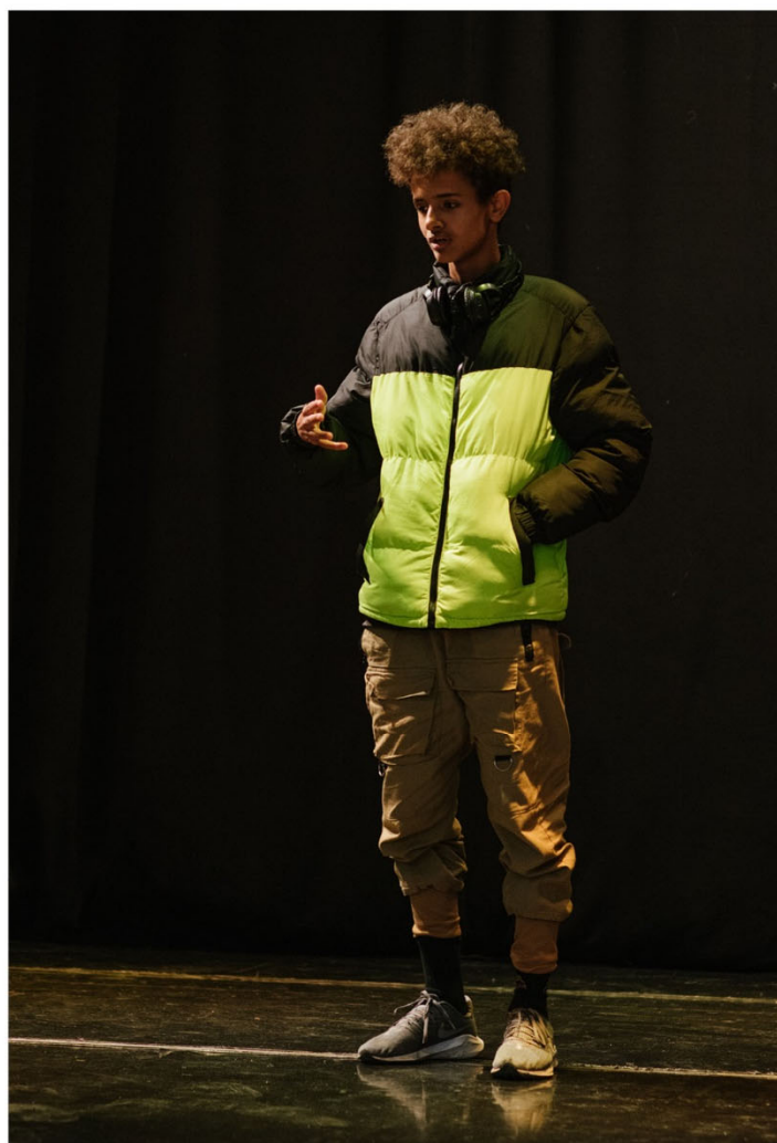
Fra forestillingen "Livsglæde og alt det rundt om", Story of My Life , Gentofte 2021.