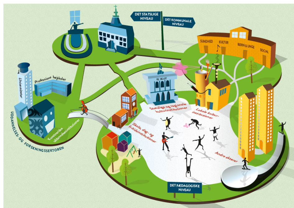
Figur 1: Økosystemet for børn og unges kulturliv. Illustrator: Jacob Tesch.

I dette kapitel beskrives det økosystem, som regulerer og definerer børn og unges muligheder for kunstnerisk deltagelse. Et biologisk økosystem kan defineres som en "afgrænset del af naturen, hvor organismer eksisterer i en vekselvirkning med hinanden og det omgivende miljø." 42 I denne rapport bruges økosystem-begrebet som en metafor til at kortlægge og beskrive, hvordan børn og unges kunstneriske medborgerskab bliver til i et større netværk af institutioner og aktører, der opererer på forskellige niveauer, men som alligevel må ses som del af et sammenhængende system. 43 Det er vigtigt at påpege, at dette kapitel ikke er et forsøg på at beskrive alle de faktorer, der påvirker børn og unges kunstneriske deltagelse, hvilket også ville inkludere faktorer som medier, forældre, venner osv. Modellen begrænser sig til en kortlægning af de væsentligste af samfundets aktører og institutioner, der på forskellige måder arbejder med og/eller har ansvar for, at der stilles lige og passende muligheder til rådighed for børn og unges aktive deltagelse i kulturlivet. For nogle aktører i systemet er dette en central opgave – eksempelvis musik- og kulturskolen – mens andre aktører spiller mere perifer eller indirekte roller i den sammenhæng. Modellen er bygget op af tre niveauer: det pædagogiske, det kommunale og det statslige niveau, som præsenteres i de følgende afsnit.