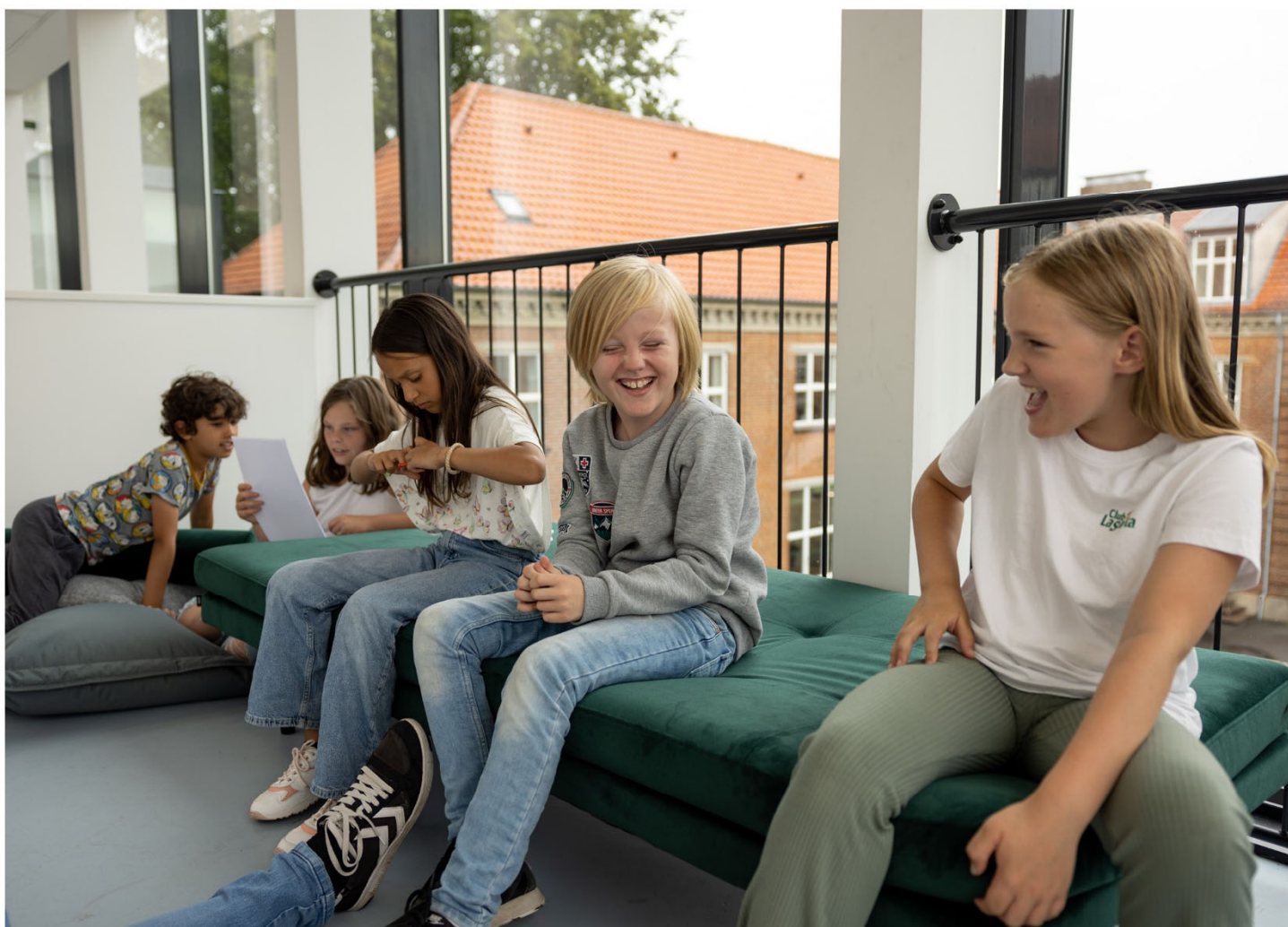
Brainstorm om tekstskrivning på Herning Musikskole, Bandfabrikkens Sommercamp, juni 2022.