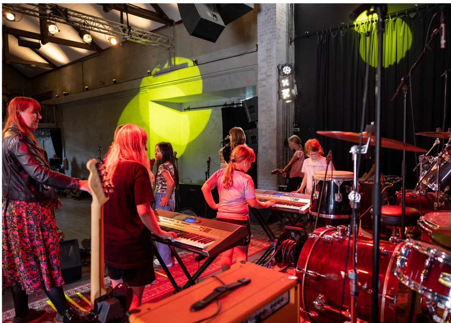
Band og banddoktor fra Ikast til Bandfabrikkens Sommercamp på spillestedet Generator, Ringkøbing.