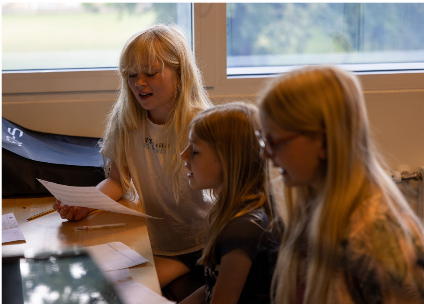
Bandfoto-take på Herning Musikskole – Bandfabrikkens Sommercamp, juni 2022. Grupper skriver tekst – Ikast-Brande Musikskole.