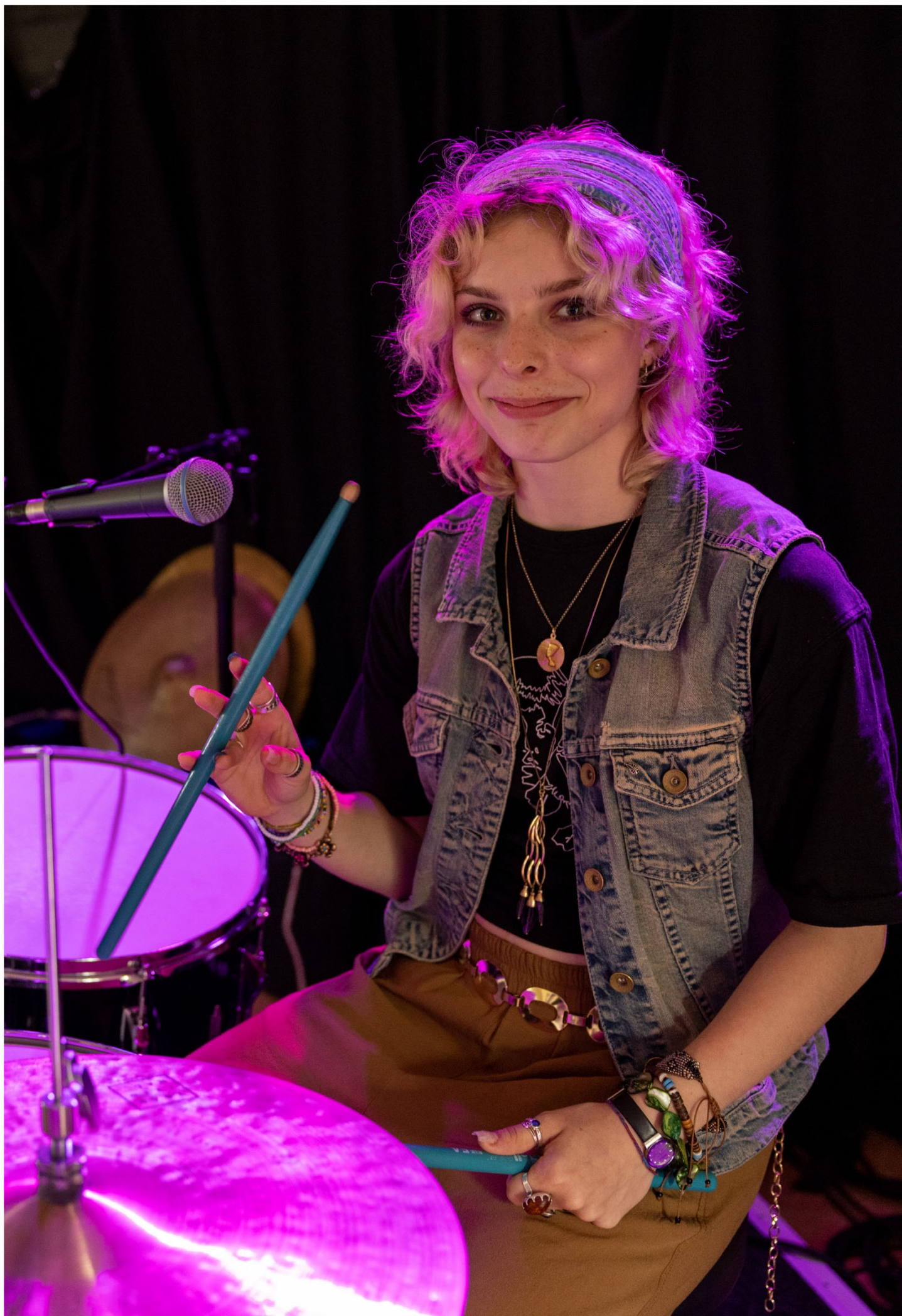
Trommeslager på 14 år fra Bandfabrikkens Sommercamp på Holstebro Musikskole.