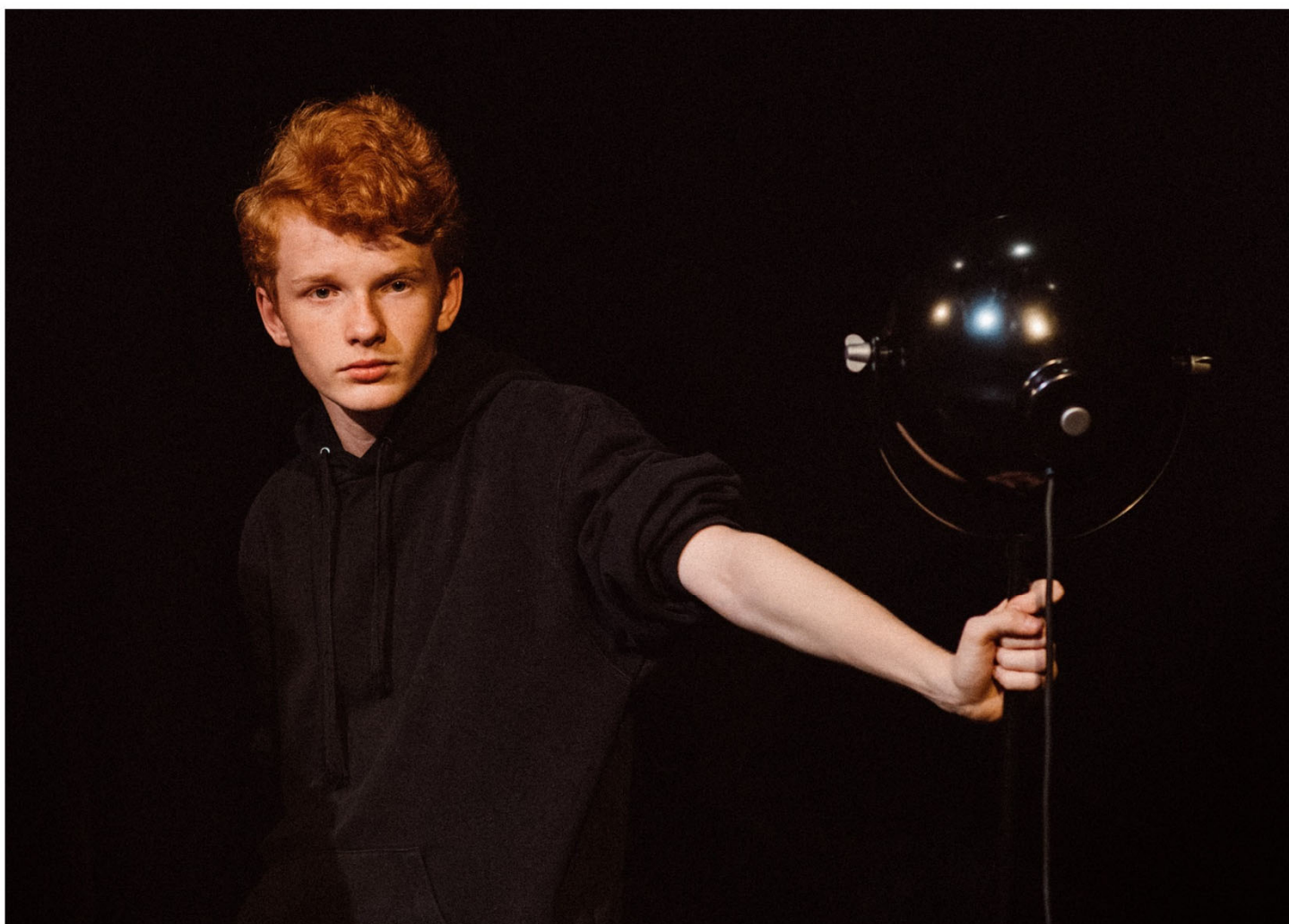
Fra forestillingen "Livsglæde og alt det rundt om", Story of My Life , Gentofte 2021.