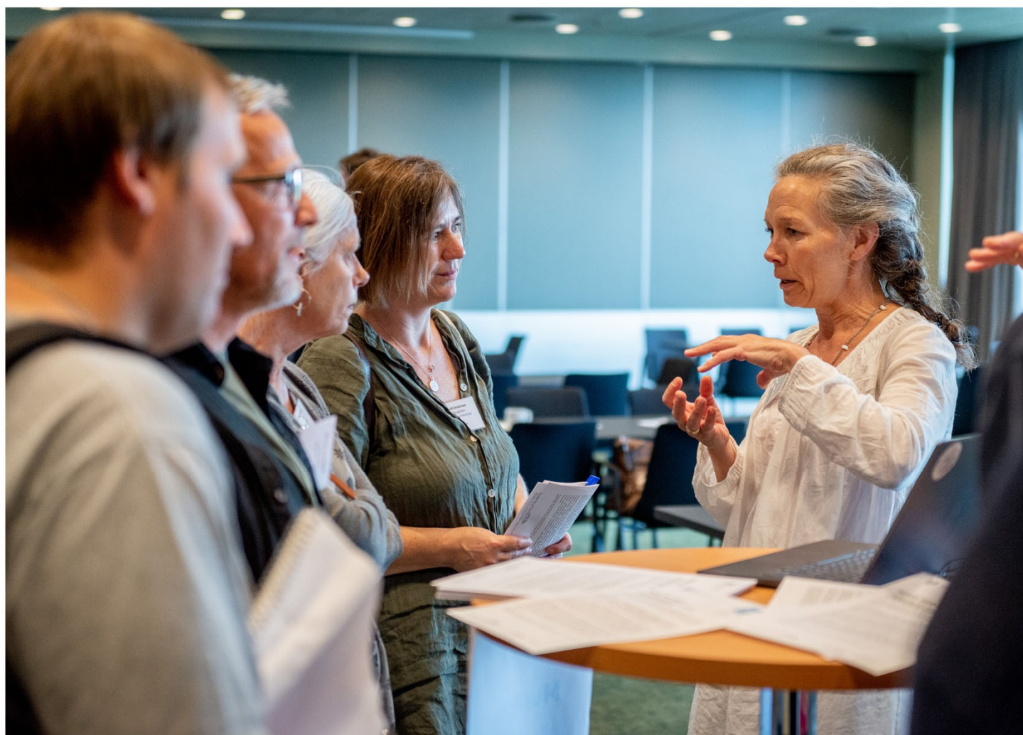
Præsentation af modelforsøg ved Praksislaboratoriet, juni 2022.