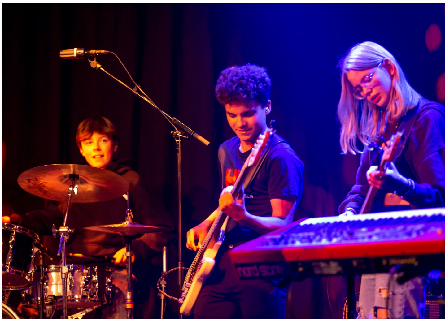
Band med medlemmer på 9-11 år spiller første koncert med Bandfabrikken på Fermaten i Herning.