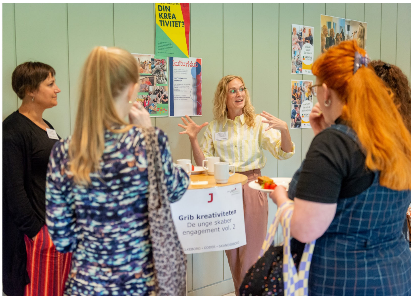
Præsentation af modelforsøg ved Praksislaboratoriet, 22. juni 2022.