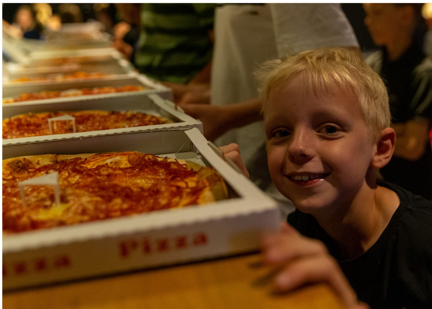
Fællesspisning i baglokalet på Fermaten til første koncert med Bandfabrikken i Herning.